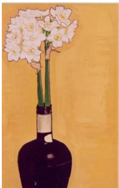
『陽射しの中の水仙』画 畑中光昭