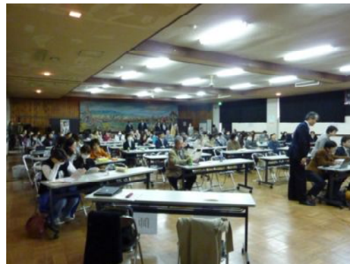
たくさん参加いただきました