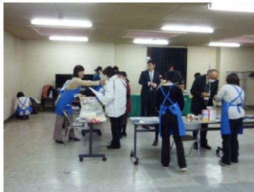
展示・相談コーナー