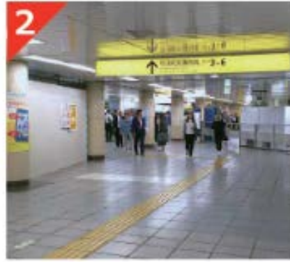
2 3～6番出口方向の改札を目指します。