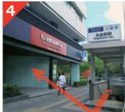
4 地上へと出てすぐ目の前のビルがビジョンセンター永田町です。