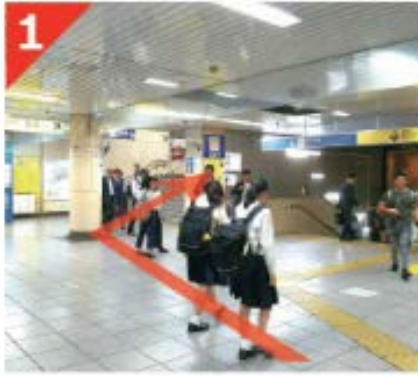
1 有楽町線・半蔵門線・南北線「永田町駅」3番出口が目的の出口です。