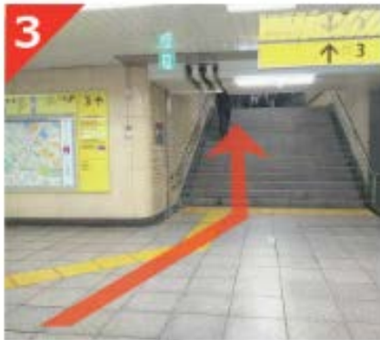
3 改札を出て右手へ進み、その先の階段を登ります。