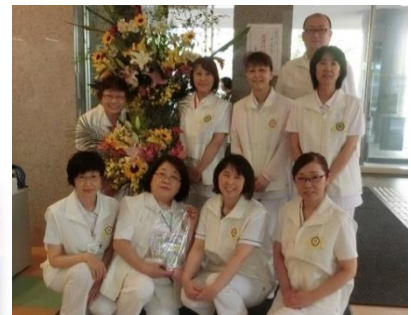
ナイチンゲールの心を忘れずに頑張っております。