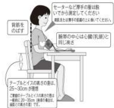
図 3 上腕カフ・オシロメトリック法による血圧測定