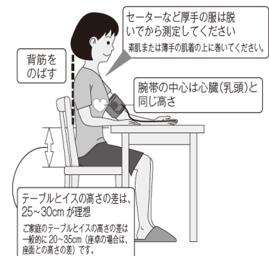
図 3 上腕カフ・オシロメトリック法による血圧測定